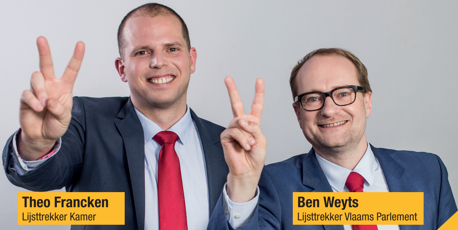
Theo Francken Lijsttrekker Kamer