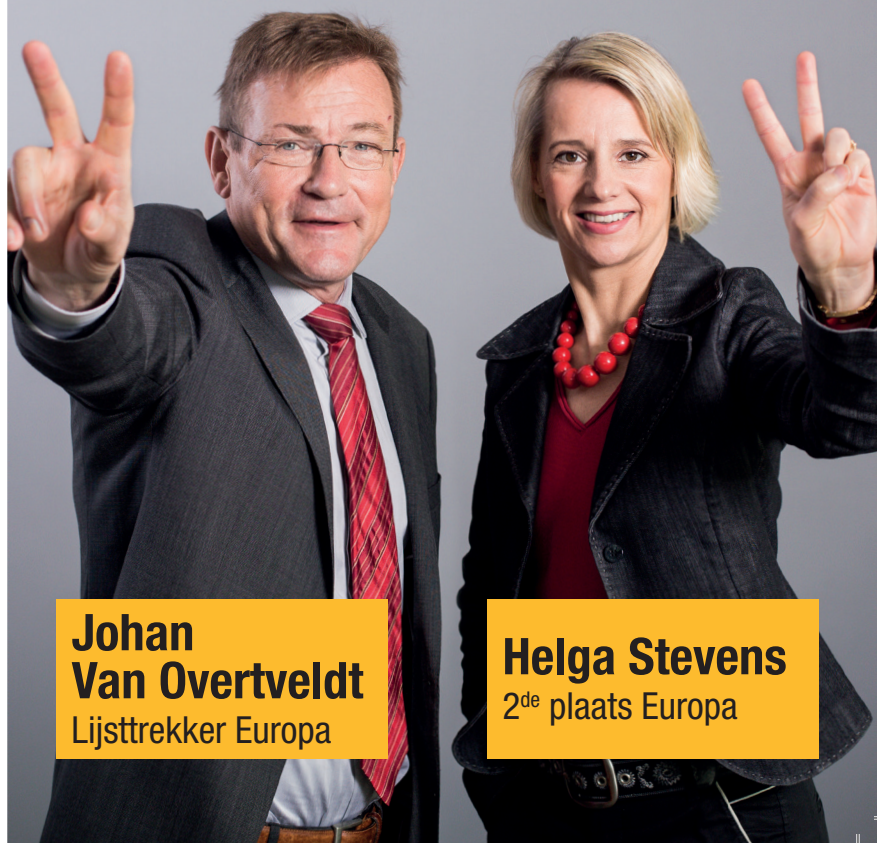
Johan Van Overtveldt Lijsttrekker Europa

De N-VA wil dat de verschillende landen van de EU hun identiteit kunnen bewaren. De EU moet niet over alles beslissen. Een Verenigde Staten van Europa, een Europese superstaat, is dus géén goed idee. De Unie moet groeien van onderuit en mag niet van bovenaf worden opgelegd.