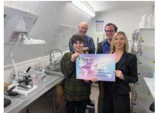
De N-VA schenkt 400 euro aan het Egel Hulpcentrum Avalon.

Avalon is uniek in Vlaanderen. U kan er op elk moment van de dag zieke of gewonde egels binnenbrengen. Er is zelfs een dropbox. Het opvangcentrum heeft veel kosten. Ze zorgen voor voeding, geneesmiddelen, de dierenarts, elektriciteit, verwarming en materiaal. De vzw is volledig afhankelijk van giften en sponsoring. Ze krijgen geen subsidies van de overheid. Daarom besliste onze afdeling om de opbrengst van onze jaarlijkse ijsjesverkoop aan de vereniging te schenken. We zamelden 400 euro in.