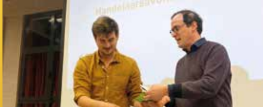
Nieuw: de Rotselaarse cadeaubon (p. 2)