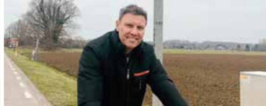
N-VA gaat voor een veilig Rotselaar (p. 3)