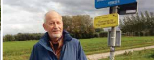
Veilige en comfortabele fietspaden (p. 3)