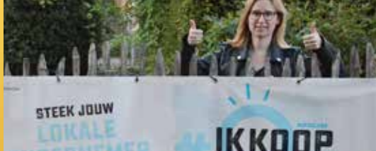
Trotsbon geeft handelaars duwtje in de rug (p. 2)